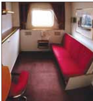
Eksempel utvendig standard lugar