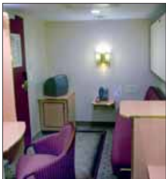
Eksempel innvendig standard lugar

* Singellugar, handikaplugar og suite på forespørsel. Handikaplugar har samme pris som N-kategori.