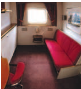
Eksempel utvendig standard lugar