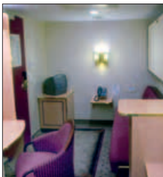
Eksempel invendig standard lugar

* Singellugar, handikaplugar og suite på forespørsel. Handikap lugar har samme pris som N-kategori.