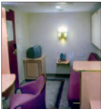
Eksempel innvendig standard lugar

* Singellugar, handikaplugar og suite på forespørsel. Handikap lugar har samme pris som N-kategori.