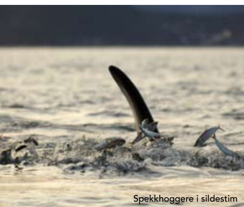
Spekkhoggere i sildestim